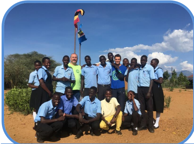
Alcuni dei 130 ragazzi sostenuti nello studio

Ogni anno scolastico è diviso in trimestri, ognuno dei quali ha un costo per frequentare le lezioni. La tariffa della retta varia in base al livello di classe raggiunto. Per spiegarci meglio il primo anno della scuola primaria avrà un costo inferiore rispetto al quinto, e così via.