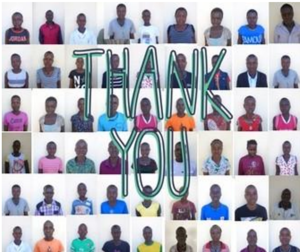
Alcuni dei 130 ragazzi sostenuti da AMCS

Normalmente per le spese amministrative utilizziamo importi compresi fra il 10 e il 20% (non superiori al 20%).