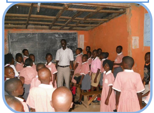
Scuola primaria “Great Valley”

Il Movimento Africa Mission-Cooperazione e Sviluppo , con la campagna “Wiva La Scuola” ha scelto di creare un fondo di sostegno al quale convogliare tutte le risorse raccolte per sostenere la crescita culturale dei bambini ugandesi attraverso il supporto a studenti e a scuole.