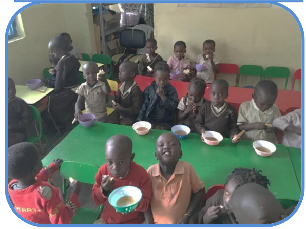
Scuola Materna "Casa della Piccola Giraffa" (Moroto)

Il ragazzo in base alla sua ambizione futura o alla sua situazione economica, può decidere di fermarsi al quarto anno e iniziare un corso professionale o continuare fino al sesto per poi iniziare l'università.