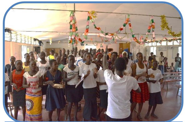
Incontro annuale dei giovani supportati

Grazie a questi passaggi riusciamo a verificare chi sono i ragazzi più meritevoli e chi invece non si impegna abbastanza dimostrando poco interesse; in questo caso siamo costretti a interrompere il sostegno per dare la possibilità a un altro ragazzo di avere la stessa opportunità di mettersi in gioco con lo studio.